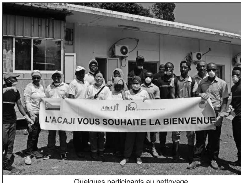
Quelques participants au nettoyage

La question du renforcement des capacités des ressources humaines a toujours été au centre de sa coopération et le président de l'ACAJI, voudrait mieux faire connaître les relations de nos deux pays, en promouvant les échanges dans les autres domaines en vue de renforcer les rapports existants.