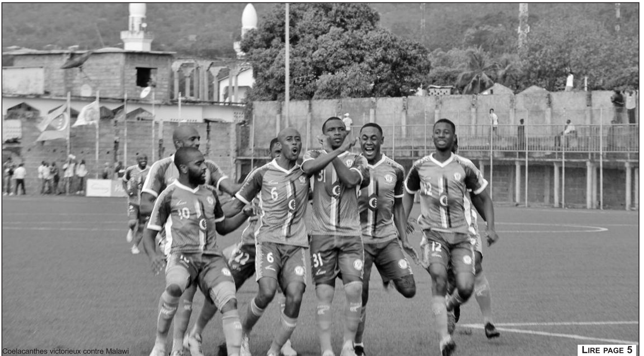
Coelacanthès victorieux contre Malawi